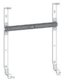
Fixation en H avec niveau à bulle